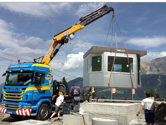
Die WOLFKABINE ist nicht nur praktisch sofort bezugsbereit, sondern wird auch vom Erzeuger angeliefert, sodass der Kunde sich seiner Kernkompetenz widmen kann.

Imposante Bilder begleiten die Arbeit des engagierten Teams von WOLFKABINE im Schweizer Seftigen. Denn vom Entwurf über den Bau und Transport bis hin zur fixen Verankerung am Zielort sind die Sommer-Brüder und ihre Mitarbeiter der beste Partner. Das ist auch der Grund, weshalb weltweit schon rund 1.000 WOLFKABINEN bestes Arbeitsumfeld bieten.