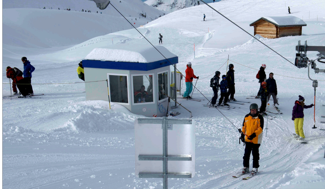
Warm und gemütlich ist es in der WOLFKABINE für die Mitarbeiter auch in Cuboté les Crosets im Schweizer Kanton Wallis.